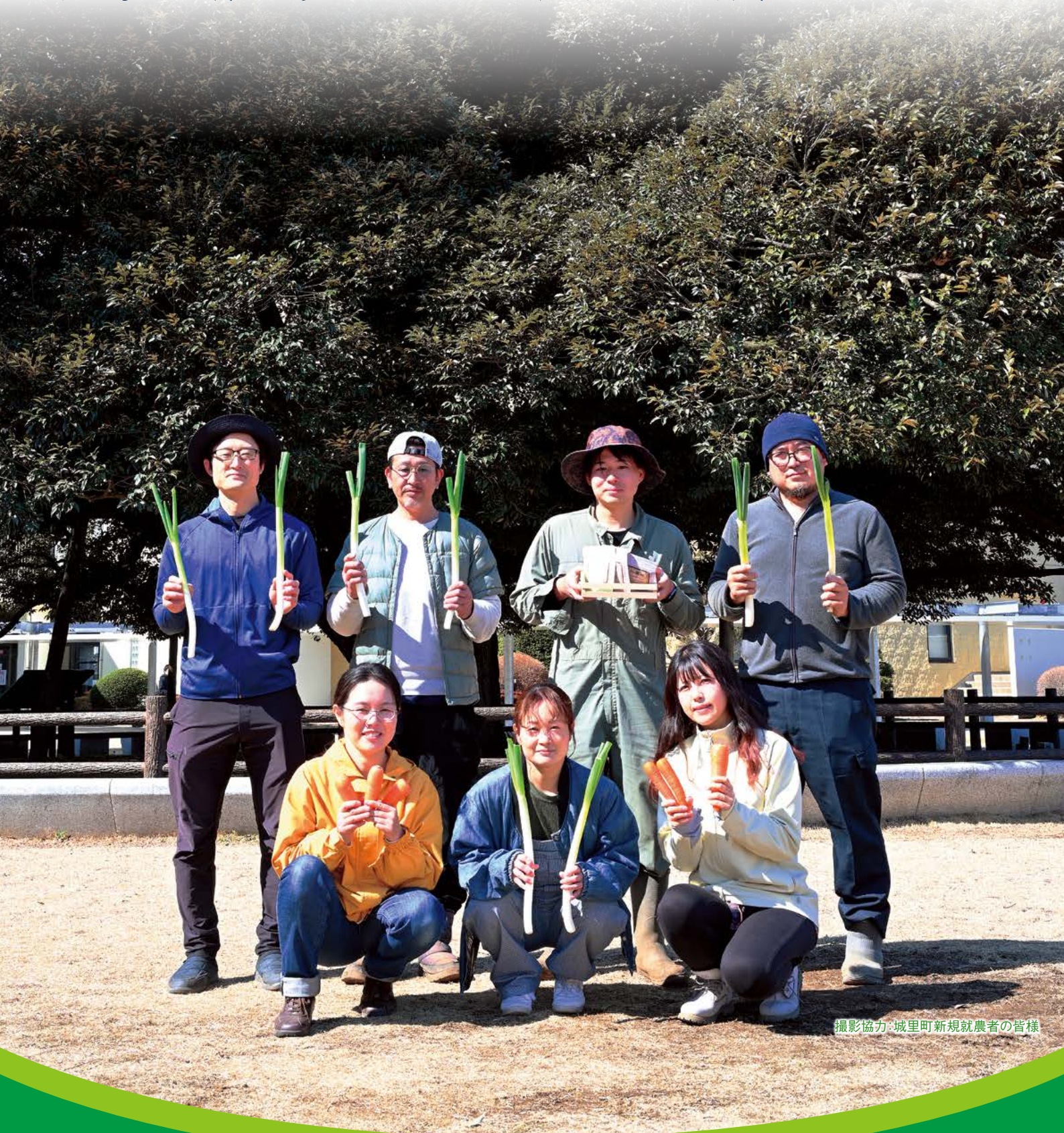
撮影協力：城里町新規就農者の皆様