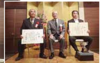
秀賞授与者と中村理事長

当社は、2月17日（金）水戸京成ホテルにおいて、市町村穀物改良協会、農協、農業改良普及センターなど関係者70名の出席をいただき、第60回稲作共進会及び第27回そば共進会の表彰式を開催しました。