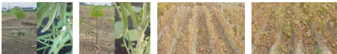
写真1 「里のほほえみ」(左)と「タチナガハ」(右)の胚軸と花

「里のほほえみ」は、関東、北陸地域の各県で認定品種に採用され、既存の品種から置き換わるように普及、拡大しています。本県においても、生産振興方針で平成29年産に800haの作付けが計画されており、普及、拡大が見込まれます。そこで、高品質(紫斑粒、しわ粒、裂皮粒などの被害粒及び未熟粒混入率15%以下；農産物検査における一等最高限度)かつ目標収量250kg/10aが得られる栽培法を開発しました。