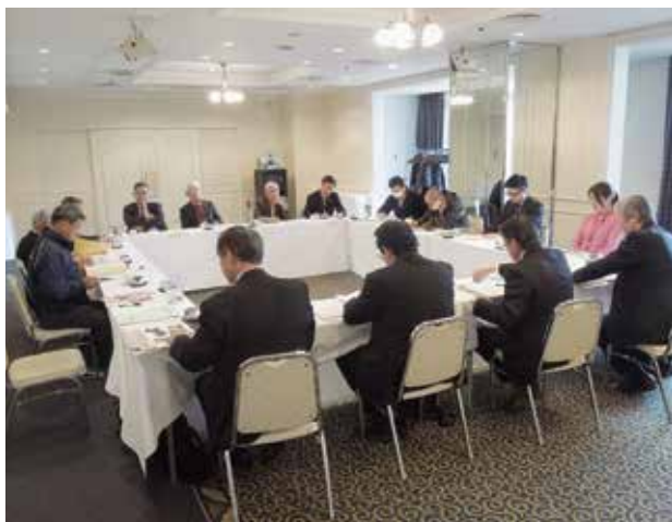
落花生生産者情報交換会

お三人とも農地の集積等による経営規模の拡大や土づくりなど基本技術の励行、機械化による経営の効率化に取り組まれており、契約栽培など安定的な生産・出荷と地産地消や消費拡大などの取り組みが評価されたもので、今後のご活躍が期待されます。