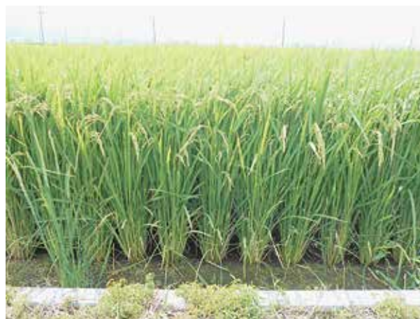
写真1 「月の光」の立毛状況 (H28年、登熟期、筑西市)

「月の光」は、近年、県内で問題となっているイネ縞葉枯病に抵抗性があり、いもち病にも強く、強稈の多収品種です(写真1)。また、晩生品種のため、収穫時期はコシヒカリより1週間～