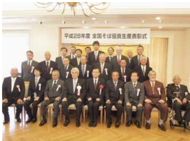
全国そば優良生産表彰式